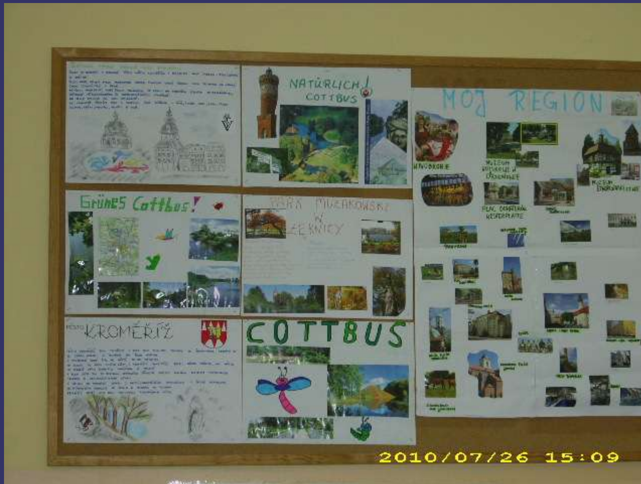
Folder: „Tu mieszkam”